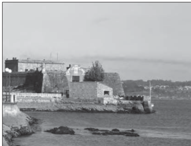
Forte coruñés de San Antón

Os castigos cruentos non resultaban acaídos para a consecución dos anteriores obxectivos, porén, a privación de liberdade presentábase como o medio máis efectivo. Era un castigo divisíbel até o infinito, polo que respondía ás esixencias do principio de proporcionalidade da pena co delito cometido. Actuaba de forma suave, cando menos en aparencia, sobre o corpo do condenado á vez que ofrecía grandes posibilidades de dobrear a súa vontade, cumprindo deste xeito co fin de prevención especial e respectando os postulados derivados do humanitarismo ilustrado. En canto ao efecto disuasorio respecto das inclinacións delituosas da poboación (prevención xeral), o Marqués de Beccaría, unha das figuras máis relevantes da reforma xurídico penal levada a cabo pola Ilustración, sinalaba: