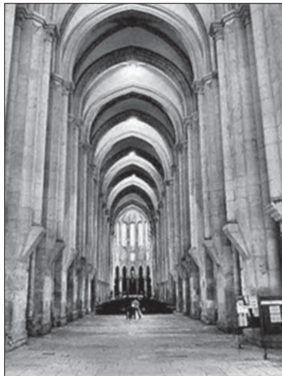
Mosteiro de Alcobaça

O fenómeno monacal 33 elaborou formulacións e prácticas de peche en cela con finalidades penitenciais e correccionais que imos ver, tempo despois, como inflúen no Dereito Penal e nos postulados institucionais do mundo carcerario. A preferencia da Igrexa por castigos non cruentos, e a crenza na posibilidade de emenda a través do arrepentimento e a oración, fixeron que a pena privativa de liberdade atopase bo acomodo no dereito canónico. Orixinariamente a prisión eclesiástica foi aplicada aos monxes e membros do clero rebeldes ou condenados pola comisión dun delito, aínda que máis tarde estendeuse aos segrares acusados de herexía; e é que a Idade Media caracterizouse polo estreito vínculo que uniu relixión e Estado 34 , propiciando que as sancións relixiosas se estendesen á lexislación civil 35 .