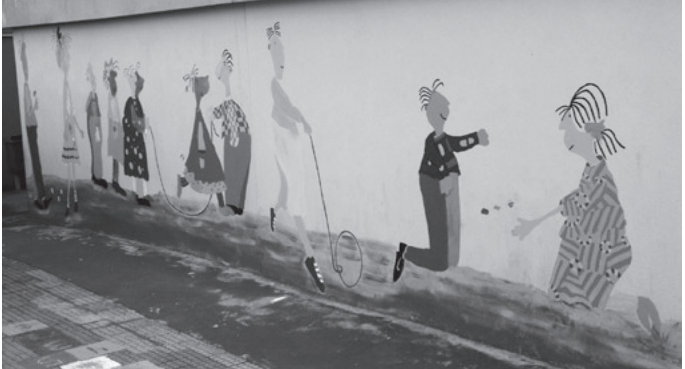
Patio de CPI de Boimorto

ción das emocións, na formación da personalidade, na integración social, na saúde, na educación, na construción igualitaria, no reforzamento dos lazos sociais e mesmo na economía local. O esquema que segue mostra os tres grandes movementos existentes no dominio da cultura física, e pódese considerar que cada un deles participa á súa maneira, de maneira totalmente complemen-