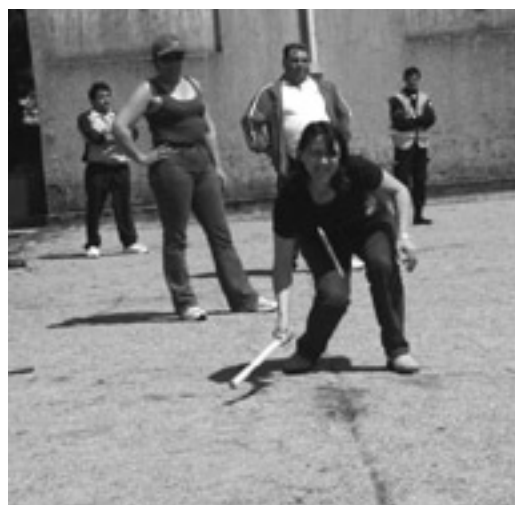
Equipo de xogadoras de estornela de Esteiro-Muros

deben de maneira urxente cuestionarse o problema de saber se se lle pode deixar facer todo ao mercado . Efectivamente, cando se perde a cultura propia tamén se perden as referencias sociais, e ben sabemos que o mercado utiliza sempre o vector cultural como cabalo de Troia. Así pois, a publicidade diríxese prioritariamente para un mesmo produto cara os rapaces máis influenciables máis ben que aos adultos. O problema dos xogos tradicionais reside na economía e nas tradicións rexionais, a carón da música, da danza, da gastronomía, da arquitectura, do artesanado, do pequeno comercio, etc. Así