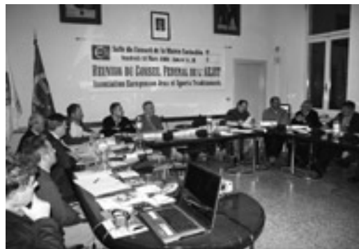
Reunión da Asociación Europea de Xogos e Deportes Tradicionais en Corinaldo (Italia) (2006)

Como abordar estas cuestións sen falar da cara comercial do deporte? En efecto, este amosa a miúdo un rostro ben diferente do anunciado na lista de valores citada anteriormente, xa que entramos no mundo dos negocios. E este mundo precisa crear actividades de masas para obter unha produción industrial rendible. Agora ben, nós sabemos que os xogos tradicionais están economicamente unidos ao artesanado. Cunha pequena demanda de material, non creou endexamais grandes fábricas; téntase entón utilizar a estratexia da aculturación para impoñer un novo modelo. Esta é ben coñecida: primeiro é necesario facer desaparecer as referencias á cultura local para crear unha situación nova cun medio novo, pois é a lei do máis forte a que se impón. No entanto, os estados